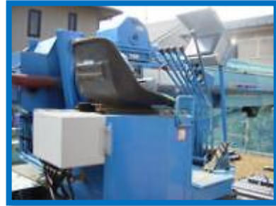
操作盤・制御盤 取付例